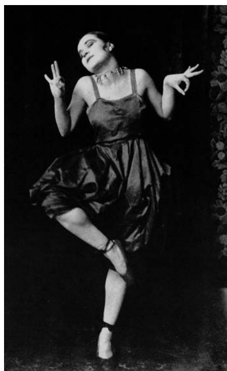
Valeska Gert und ihr »Tanz in orange« (1916)

V aleska Gert kehrt zum 120. Geburtstag nach Kampen zurück. Vom Pfingstamstag bis zum 29. Juni 2012 zeigt das Kaamp-Hüs die vom MMZ erarbeitete Ausstellung über die Pionierin des deutschen Ausdruckstanzes, die exzentrische Schauspielerin und Kabarettistin sowie die langjährige Wirtin des Kampener »Ziegenstalls«, jenem legendären Lokal, das bis 1978 Sylter Feriengäste, unter ihnen Prominente wie Peter Frankenfö, Gert Fröbe oder Werner Höfer, magisch anzog. Infos unter: www.kampen.de