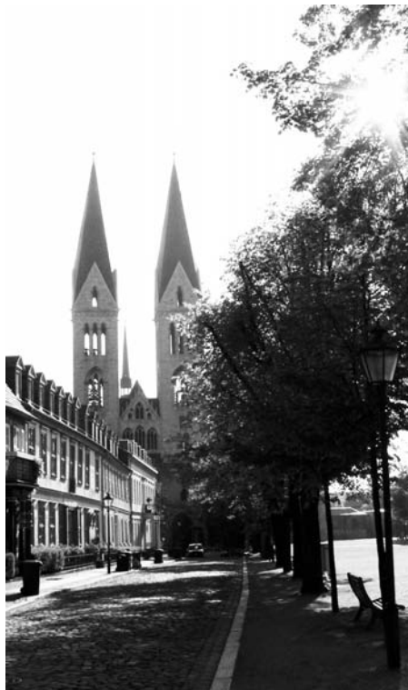
Der Halberstädter Domplatz

Ein gemeinsamer Antrag auf UNESCO-Weltkulturerbe der Städte Halberstadt (Sachsen-Anhalt) und