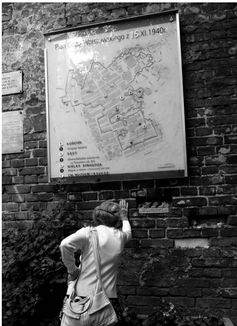
Das Holocaustkind Stella Kochawa Tzur vor der Mauer des ehemaligen Warschauer Ghettos.

Promotionsstipendiatin der Friedrich-Naumann-Stiftung für die Freiheit im Walther-Rathenau-Kolleg. Das Thema ihrer Dissertation lautet: »Durch Taufe befreit? Die religiös-nationale Identität der polnischen Holocaustkinder nach 1939.«