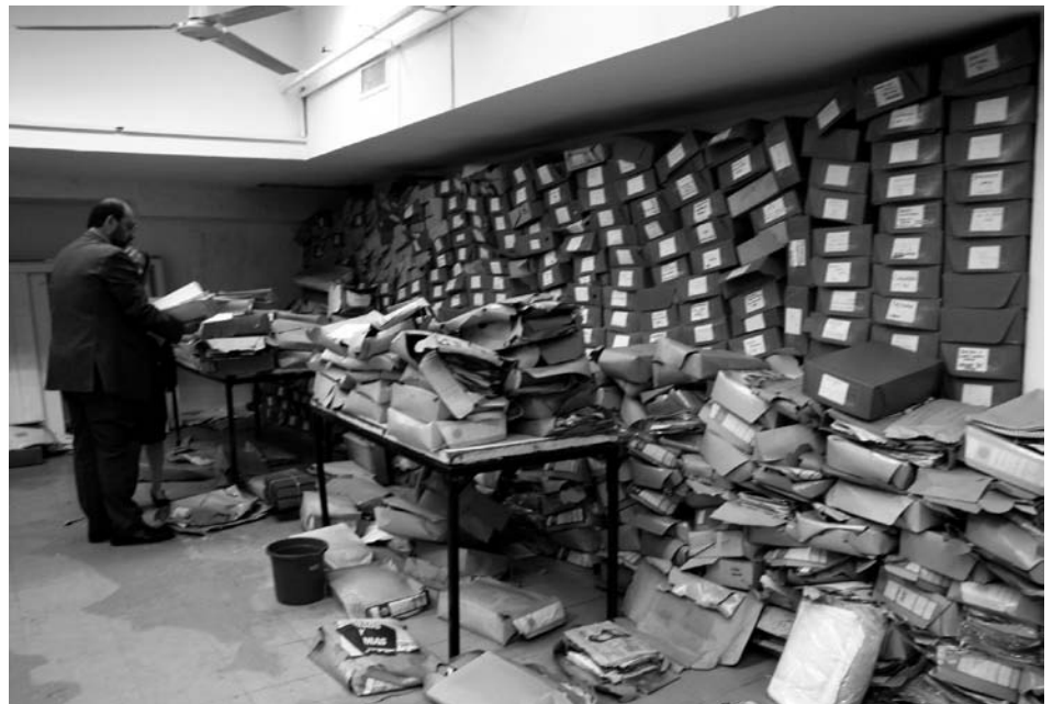
Nach dem Bombenattentat auf das Jüdische Gemeindezentrum in Buenos Aires (1994) wurden die aus den Trümmern geborgenen Archivalien an verschiedenen Orten provisorisch gelagert und warten bis heute auf eine Erfassung.

dankte für den Anstoß, nach Dokumenten über die eigene Familiengeschichte zu suchen, denn ihre Eltern hätten nie mit ihr über deren Weggang aus Deutschland gesprochen, und sie sehe es nun an der Zeit, diese – für viele Immigranten der zweiten Generation nur wenig bekannte – Familiengeschichte und damit auch die eigene Herkunft zu beleuchten.