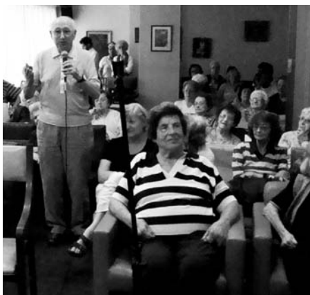
Treffen mit Bewohnern der Seniorenresidenz VidaLinda