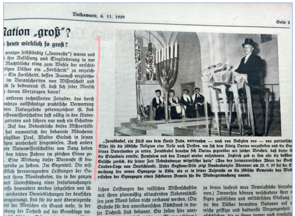
Aus der Sammlung der Gumbel-Forschungsstelle: Die völkisch-antisemitische »Volkswarte« hetzt gegen die Neueinweihung der Kölner Synagoge – wenige Wochen, bevor sie Weihnachten 1959 mit Hakenkreuzen beschmiert wird.