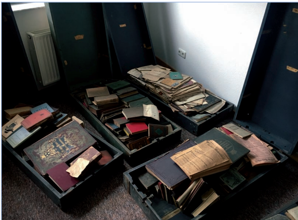
Munitionskisten mit Tausenden von Büchern, die vormalig wohl deportierten Berliner Juden gehörten.