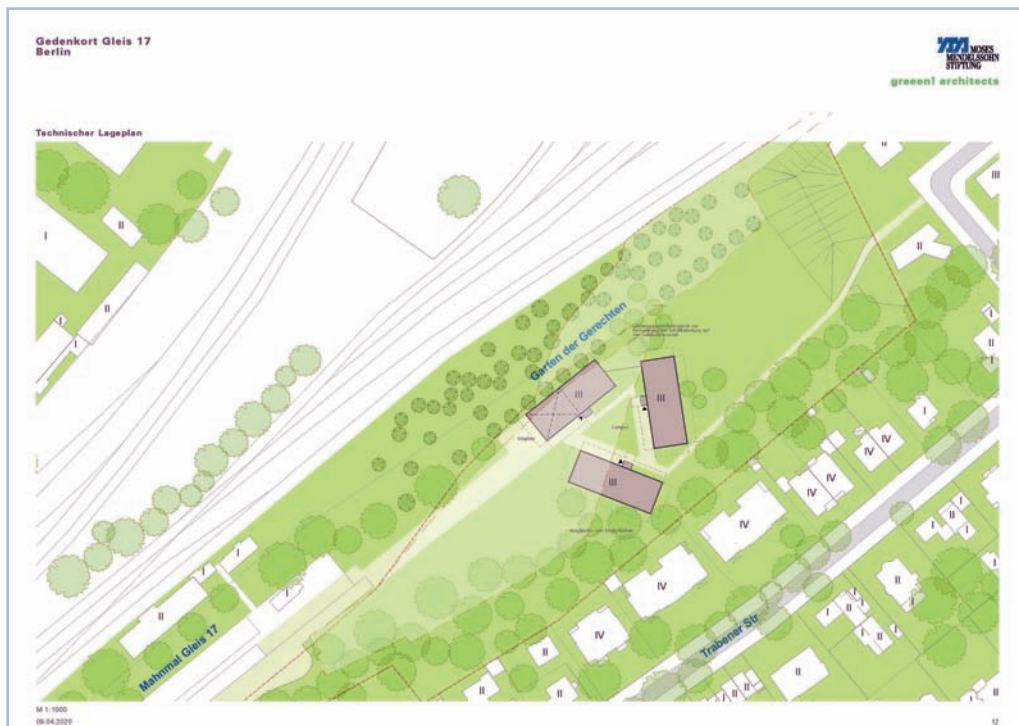
Ein erster Entwurf des geplanten Else Ury Campus.

Das Ziel des Else Ury Campus ist es, einen Ort zu schaffen, an dem sich gesellschaftspolitisch engagierte und geschichtsbewusste Studierende aus verschiedenen Wissenschaftsdisziplinen begegnen, um an einem historisch authentischen Ort gemeinsam zu wohnen, zu arbeiten, zu lernen und ihr Wissen weiterzugeben. Das heißt, angehende Akademiker aus geisteswissenschaftlichen Disziplinen wie Alltags-, Kultur-, Migrations- und Sozialgeschichte, Politikwissenschaft, Didaktik, Pädagogik, Soziologie und