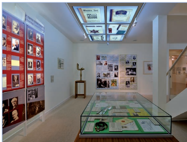
Ausstellungsraum des Jeckes Museum Tefen.